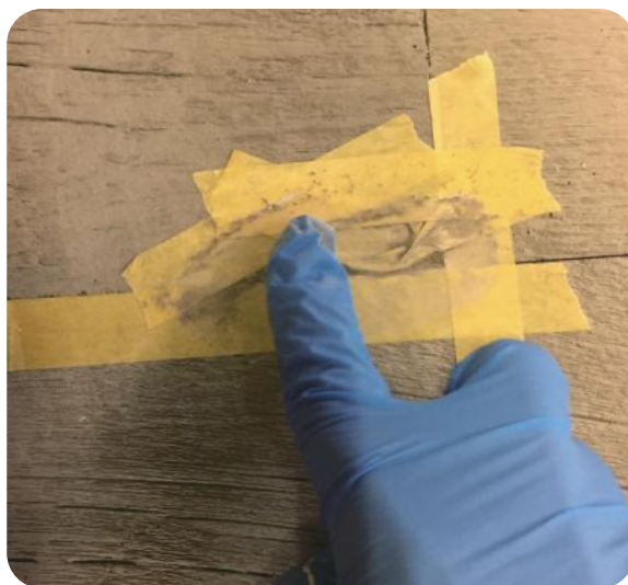
Step4 : 専用セメントをジョイントコークに馴染ませます