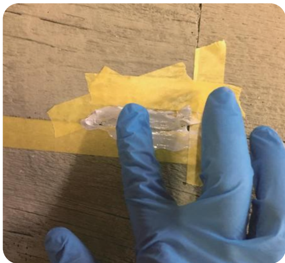
Step3 : ジョイントコークをならします