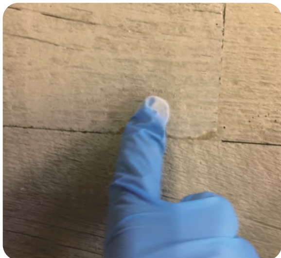
Step5 : マスキングテープをはがし、はみ出したジョイントコークに、専用セメントを馴染ませます