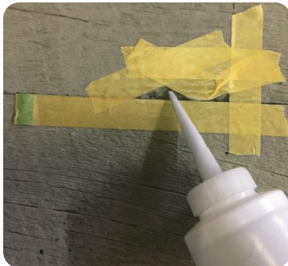
Step2 : ジョイントコーク(グレー)を流し込みます